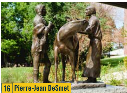
16 Pierre-Jean DeSmet

El homónimo de Carroll Hall, el P. John Carroll, S.J., fue el primer arzobispo de los Estados Unidos y fundador de Georgetown University. El edificio también albergó una famosa reunión entre el presidente Bill Clinton y el papa Juan Pablo II en 1993. Actualmente, muchas oficinas de profesores residen aquí.