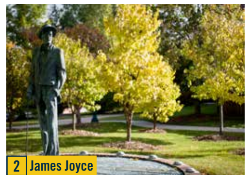
2 James Joyce