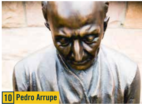
10 Pedro Arrupe

Construido en 1887, este es el edificio emblemático de Regis, el que verás en postales e innumerables fotos de graduación. Los propietarios anteriores de esta área acordaron entregar el terreno a la Regis Jesuits de forma gratuita si Main Hall se podía construir en menos de 100 días; terminó tomando solo 97 para completar el exterior del edificio.