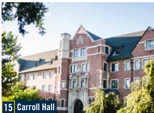
15 Carroll Hall

Una escultura de tamaño natural de San Ignacio de Loyola, el soldado y misionero español del siglo XVI que llegó a formar la Sociedad de Jesús, una orden jesuita.