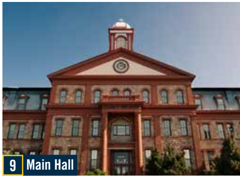
9 Main Hall

Construido en 1887, este es el edificio emblemático de Regis, el que verás en postales e innumerables fotos de graduación. Los propietarios anteriores de esta área acordaron entregar el terreno a la Regis Jesuits de forma gratuita si Main Hall se podía construir en menos de 100 días; terminó tomando solo 97 para completar el exterior del edificio.