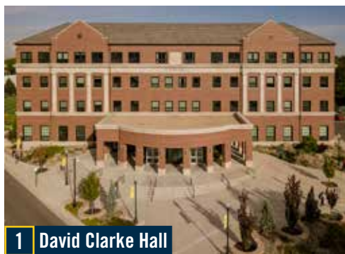
1 David Clarke Hall

Mientras disfruta de su recorrido, tenga en cuenta que se trata de una comunidad universitaria activa y absténgase de ingresar a las aulas de las sesiones, las residencias universitarias o las áreas de estudio designadas.