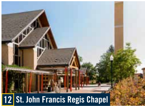
12 St. John Francis Regis Chapel