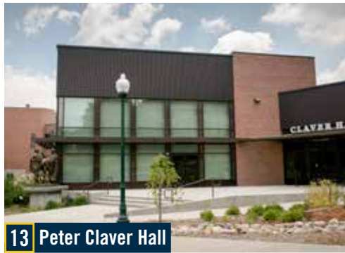
13 Peter Claver Hall

Un oasis de calma en un campus bullicioso, la capilla ofrece misas católicas diarias y es el hogar del Ministerio Universitario. Los estudiantes y profesores de todas las religiones son bienvenidos aquí, con frecuentes servicios interreligiosos y pequeños grupos de reflexión durante todo el año.