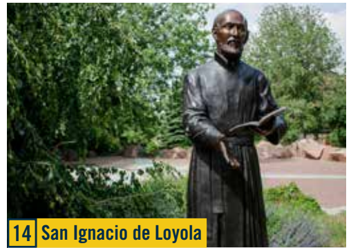
14 San Ignacio de Loyola

Claver Hall alberga el Rueckert-Hartman College for Health Professions, incluido el Simulated Health Center, que brinda a los estudiantes una experiencia práctica en los estudios de ciencias de salud. También contiene el Department of Fine & Performing Arts, St. Peter Claver, S. J. Recital Hall y Claver Cafe.