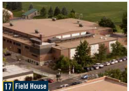
17 Field House

Esta estatua muestra al misionero jesuita nacido en Bélgica Pierre-Jean De Smet conversando con un miembro de la tribu Flathead de Montana. En la base de la estatua se pueden encontrar réplicas de petroglifos de nativos americanos.